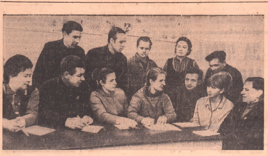
НА СНИМКЕ: идет заседание группы народного контроля трамвайного управления.

И сейчас нередко можно увидеть в дело такую картину. Вагон после осмотра или ремонта готов к выходу на линию, но народные контролеры снова и снова тщательно проверяют качество ремонта, чтобы техника не подвела в процессе эксплуатации, чтобы пассажирский поток был бесперебойным.