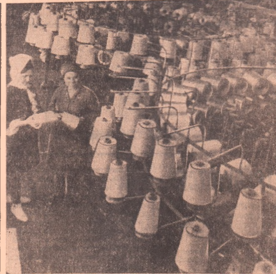
На снимке: в кругловязальном цехе фабрики бельевого трикотажа.