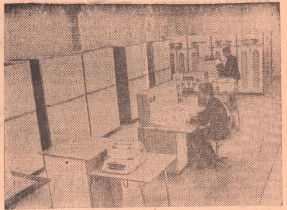
На Южуралмашзаводе полным ходом идет монтаж и наладка электроно-вычислительной машины «Минск-22». НА СНИМКЕ: специалисты вычислительного центра завода ведут отладку отдельных блоков машины.