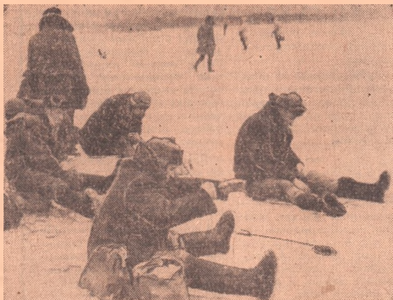
Пришла долгожданная пора для любителей подледного лова рыбы.