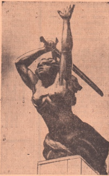
Над гранитным пьедесталом подвела на врага меч Ника. Это памятник варшавянам, сражавшимся с гитлеровскими оккупантами за будущее Польши в период 1939—1945 годов.

Обращаться по адресу: ул. Короленко, 26.