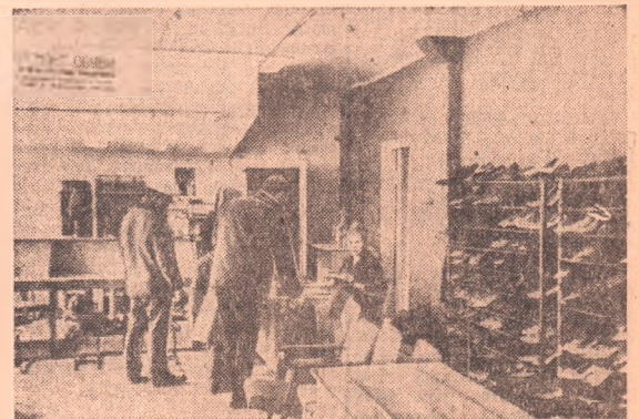
В мастерской «Сапожок».