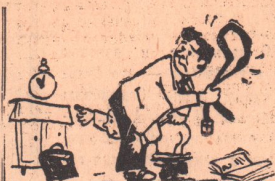
— Папа, опять соседи скажут, что мы шумим после 10 часов.