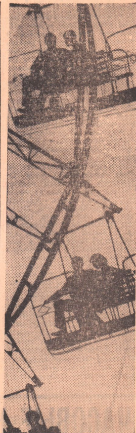
«НА СЕДЬМОЕ НЕБО». Фотоэпизод И. Нестерова.

ФВ05120. Орская типография Оренбургского управления по печати. Заявка № 2983. Тираж 26.007.