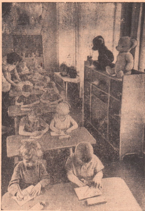
В новом детском саду № 80.