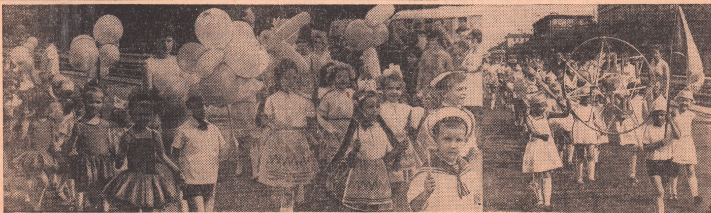
1 июня орчане отметили Международный день защиты детей. На СНИМКЕ: по Комсомольской площади шагают воспитанники детских садов города.

С перевыполнением заданий работают все цехи металлургического цикла — плавильный, обжигово-восстановительный, кобальто-сульфатный, электролизный.