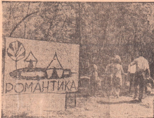
Гостеприимно встречает палаточный городок своих первых посетителей. В оформлении турбазы комсомольцы вложили немало выдумки, фантазии. На снимке: вход на турбазу «Романтика».

Радиоузел оповещает о начале концерта. С удовольствием встретили транспортники самостоятельных артистов.