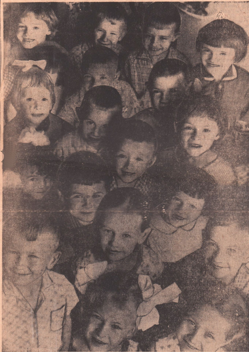
СЧАСТЛИВОЕ ДЕТСТВО У НАШИХ РЕБЯТ.