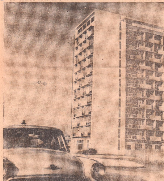
Улан-Батор — сегодня. Новая комфортабельная гостиница «Баян-гол» открылась недавно на проспекте Ленина в центре монгольской столицы.