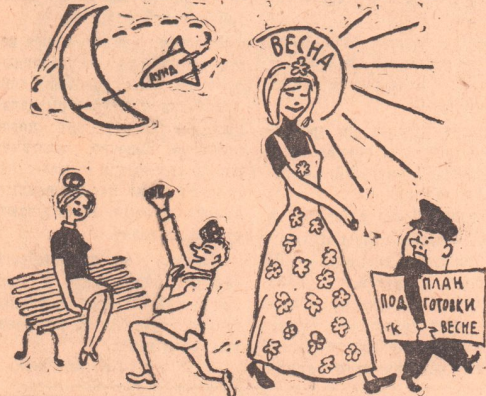
— Ниночка, я для вас буду таким же верным спутником.