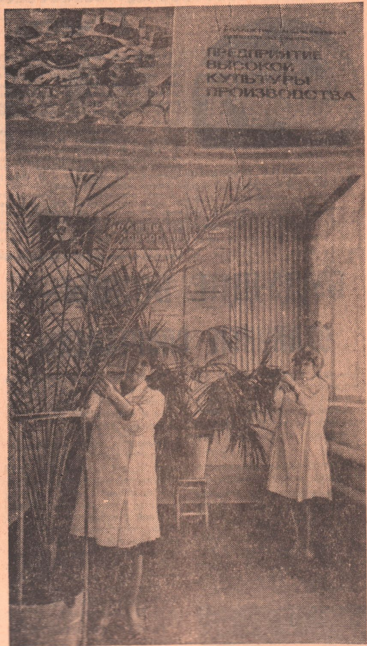
Хлебокомбинат. Коллектив предприятия борется за высокую культуру производства.

Осенью прошлого года в переулке Театральном к домам