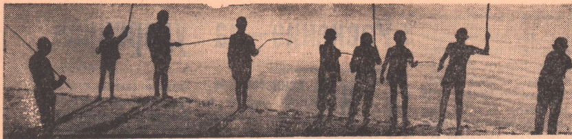
Много в эти дни на берегах Урала людей с удочками. И среди них — всегда ребятшки...