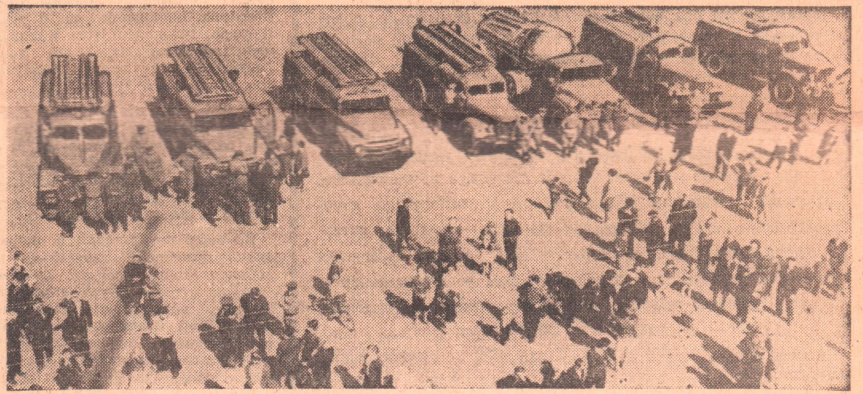
На снимке: смотр противопожарной техники на Комсомольской площади.