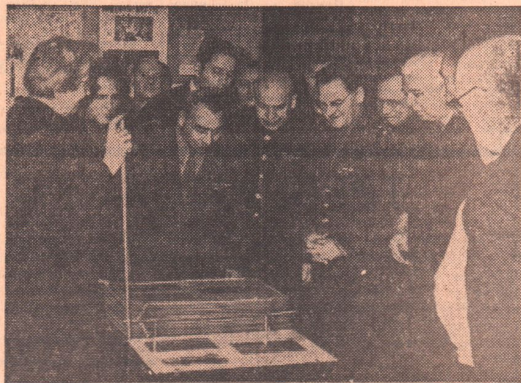
К 150-летию со дня рождения Карла Маркса. В музее Карла Маркса и Фридриха Энгельса, на снимке, посетители знакомятся с фотографией из альбома семьи К. Маркса.

Бюро горкома КПСС вынесло взыскания руководителям ОРСа, в принятых решениях наметило меры по решительному улучшению деятельности всего коллектива.