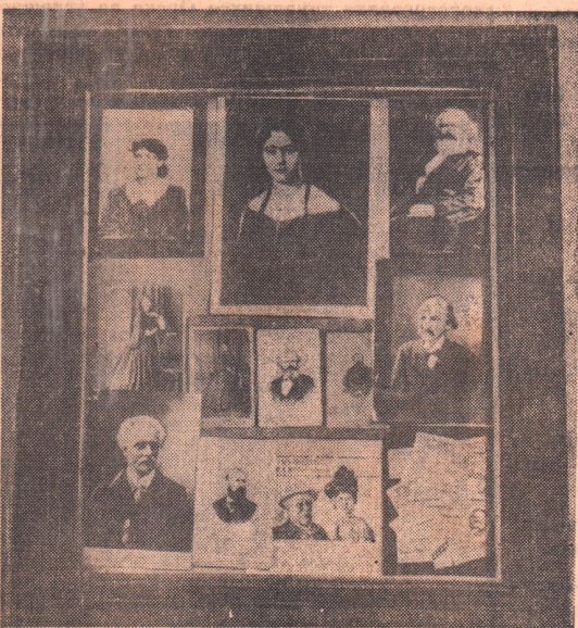
К 150-ЛЕТИЮ СО ДНЯ РОЖДЕНИЯ КАРЛА МАРКСА На снимке: фотографии членов семьи К. Маркса и его близких, объединенные одной рамкой. Они находились в кабинете Г. В. Плеханова в Женеве.

Переход на пятидневную рабочую неделю дает существенные результаты. За счет