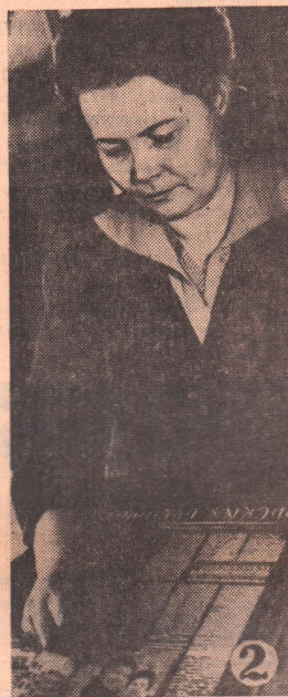
жие оттиски полос поступают в корректорам.