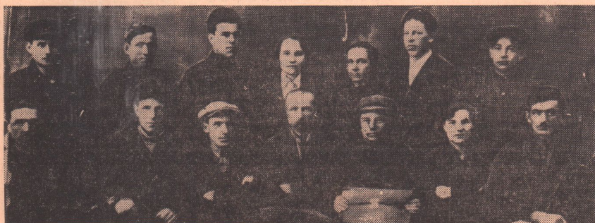
Орские полиграфисты. (Снимок 1927 года).

Адрес: г. Орск, пос. Октябрьский, контора треста.