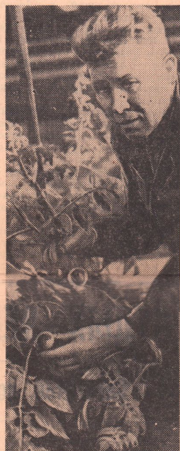
Завод строительных машин.

15 МАРТА 18.30 — «Мелодия на льду» — телевизионный фильм. 19.00 — Телевизионные новости (местные). 19.15 — Киножурнал. 19.25 — Концерт для работников редакции и типографии, рабкоров газеты «Орский рабочий» в связи с 50-летием со дня выхода первого номера городской газеты. 20.15 — Передача «Спокойной ночи, малыши». 20.25 — Передача. В помощь изучающей историю КПСС. Тема: «Партия большевиков в период подготовки и проведения Октябрьской революции». 20.35 — «Доктор Шлоттер» — телевизионный фильм (3 серия).