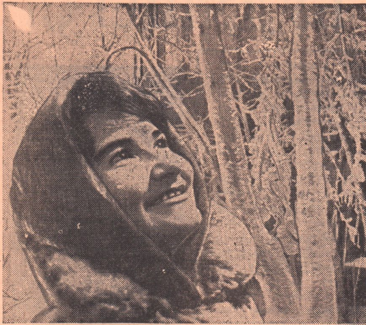
В ЗИМНЕЙ РОЩЕ.