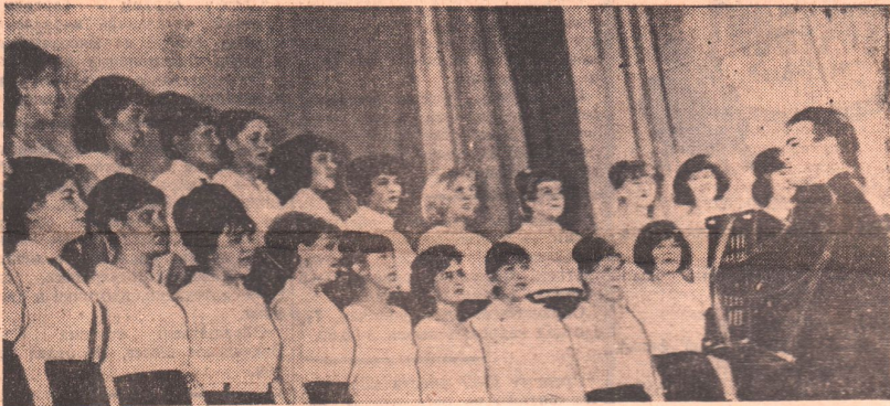
Выступает хор цеха № 1.