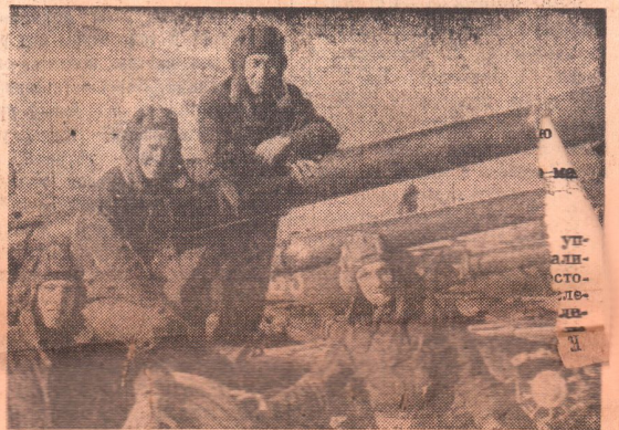
В напряженной учебе проходят будни танкистов Н-ской части Туркестанского военного округа. Войны встречали юбилей Вооруженных Сил СССР отличными успехами в боевой и политической подготовке. В условиях, приближенных к боевой, проходят учебные занятия танкистов.