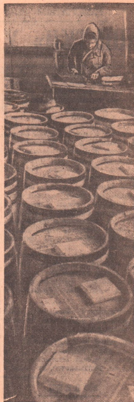
Склад готовой продукции электропечного отделения обжигово-восстановительного цеха никелевого комбината. Высококачественный гранулированный никель идет на предприятия нашей страны и в зарубежные государства.