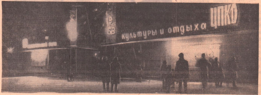
Центральный парк, расположенный в районе Комсомольской площади, стал излюбленным местом отдыха орчан. Издали видны разноцветные неоновые огни; ярко горят цифры — 1968.

Немало выдумки и фантазии приложили работники парка для его оформления.