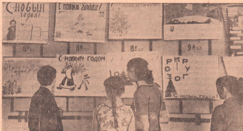
Смотря новогодних стенных газет. Первое место заняла стенгазета 8 «Б» класса.