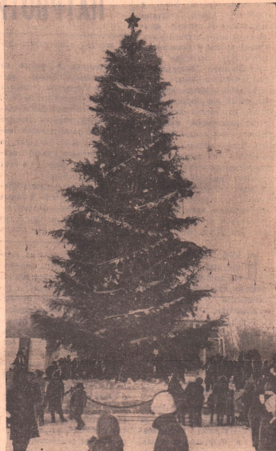
Нарядна новогодняя елка в Центральном парке культуры и отдыха.