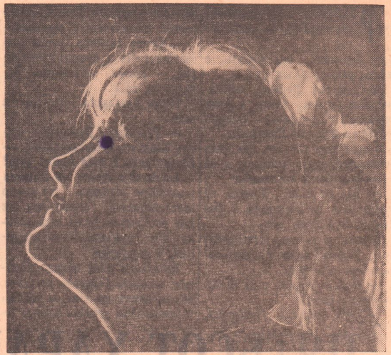
Портрет девушки.

Победители награждены дипломами горспортсоюза. В. Крюк, старший инструктор горспортсоюза.