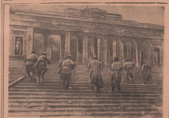
Почти два года томился Севастополь под игом фашистских захватчиков. Весной 1944 года Советская Армия, развивая свое сокровищное наступление, прогнала вражескую оборону в районе Черномора и, громя отступающие войска противника, подошла к Севастополю 7 мая 1944 года начался решительный штурм фашистских войск, засевших на североостровных укреплениях. Удары по врагу становились с каждым часом все сильнее. Обжесточенные бой развернулся на улицах города. Группа советских бойцов идет в атаку по Графской пристани.

откозах, МТС области, на судах трюмской флота проводятся беседы и лекции, посвященные великому подвигу русского народа во время Крымской войны. Севастопольской обороне посвящаются специальные радиопередачи.