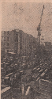
Красноармейский район. Строители города Сочи разработали и освоили производство блоков и монтажных стен из нового материала — крупнопористого бесцементного бетона. Для изготовления бетона применяется морской или речной гравий или щебень (вместо песка) и цемент. На кубометр бетона расходуется 90—100 килограммов цемента. Крупнопористый бетон по своим теплоизоляционным качествам равен кирпичной кладке. Исключительно легкого материала снижает стоимость строительного материала на 30 процентов. Социалистический трест уже возвел несколько двух- и четырехэтажных жилых зданий из бетонных блоков.

На снимке: строительство черт-реставляющих жилых домов в Сочи из блоков крупнопористого бесцементного бетона.