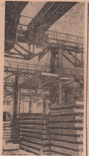
В отчет на постановление Центрального Комитета КПСС и Совета Министров СССР о развитии производства сборных железобетонных конструкций и деталей для строительства коллектива Люберецкого завода железобетонных изделий № 2 принята обязательство досрочно завершить программу план выпуска готовой продукции к 20 декабря.

В Свердловске организовано производственно-техническое бюро. Его задача — улучшение конструкций мебели, разработка новейшей технологии и внедрение ее в производство. (ТАСС).