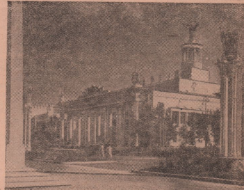
Воскресенская сельскохозяйственная выставка.

Среди речников Волго-Дона развита соревнование за вождение судов методом толкания, что намного увеличивает скорость прохождения караванов.