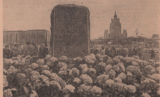
Москва, 29 мая на площади Киевского вокзала состоялся торжественный закладка монумента и памятник 300-летию воссоединения Украины с Россией. На снимке: гранитная плита, заложенная на месте, где будет воздвигнут монумент в память 300-летия воссоединения Украины с Россией.

После собрания комсомольцы и молодежь дистанции пути взяли концерт художественной самодеятельности. Встреча прошла в дружеской обстановке. Н. Левинский.