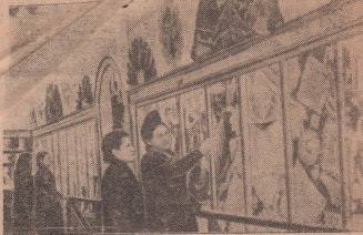
Универмаг провел пятидневную выставку-продажу строительных выставок, шелковой галереи и галустов. На снимке: выставка в универмаге по улице Строителей.