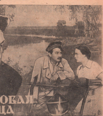
Фильм «Калининова роша» — злободневный и веселый фильм, снятый по пьесе украинского драматурга Алексея Кара Корнеячука. Производство Киевской киностудии художественных фильмов, 1953 года.