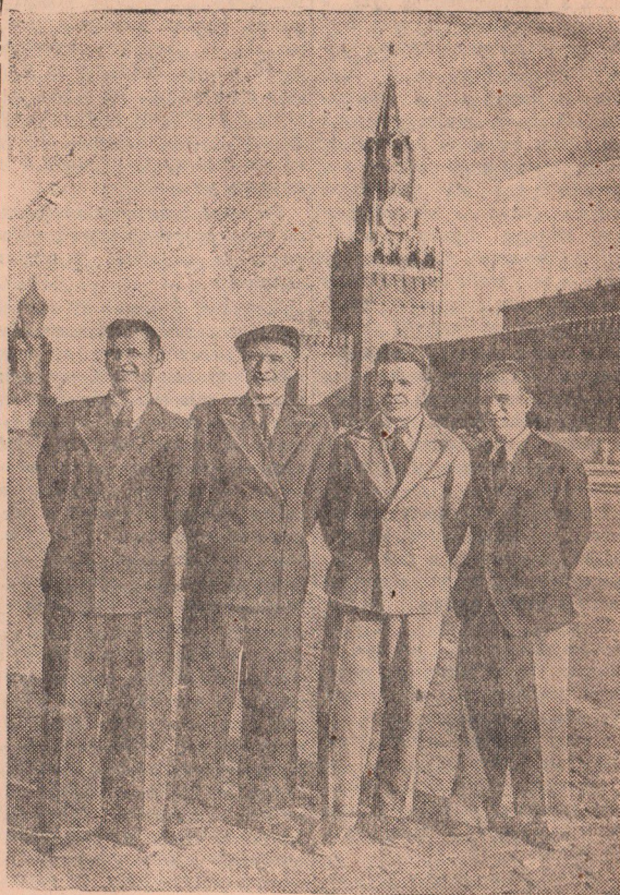
Промышленность Москвы в апреле 1949 года по большинству важнейших видов промышленной продукции достигла среднемесячного уровня производства, запланированного на 1950 год — последний год пятилетки.

Завод «Газоаппарат» освоил производство газовых стиральных машин, работающих от осветительной сети. Эти машины, отличающиеся компактностью и большой экономич-