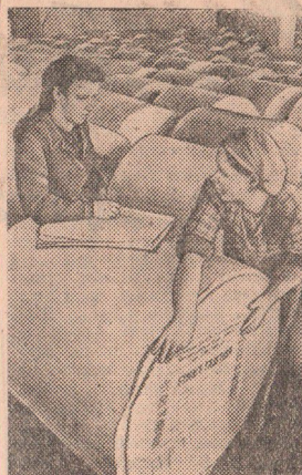
Карело-Финская ССР. На Кондопожском бумажном комбинате с начала этого года выпущено сверх плана газетной бумаги на несколько миллионов рублей.

На стадионе никелькомбината состоится встреча: «Цветмет» — машиностроительный техникум — 48-я школа. На спортивной площадке средней школы № 6 встречается волейболисты «Авангарда» и «Трактор».