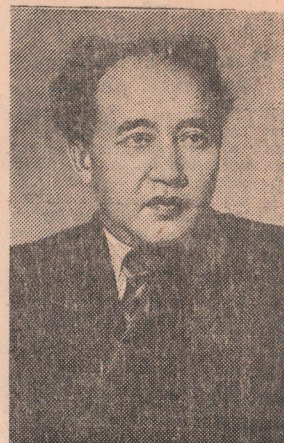
Казашский писатель М. АУЭЗОВ.

Сталинская премия присуждена за роман «Абай».