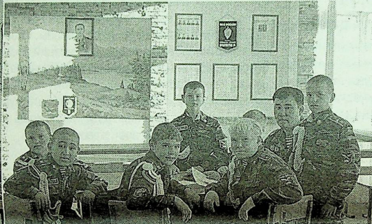
Кадетский класс имени Героя России Андрея Туркина

деокамеры. И даже спустя восемь лет в их глазах читается не только радость и гордость за своё чадо, но и тревога и печаль.